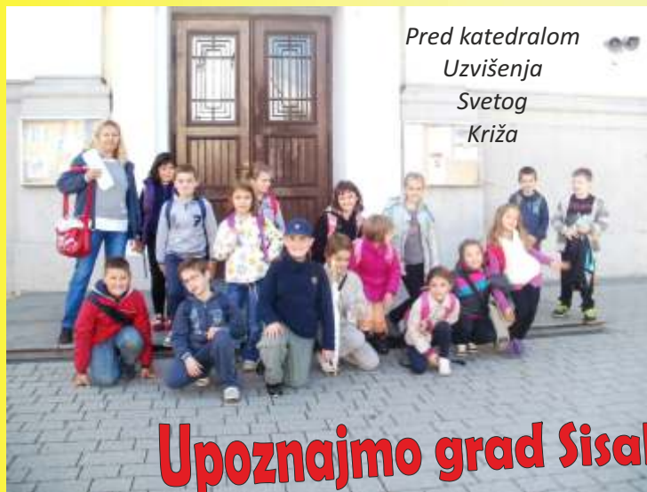
Pred katedralom Uzvišenja Svetog Križa