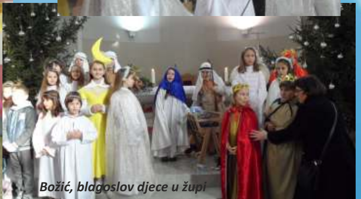
Božić, blagoslov djece u župi