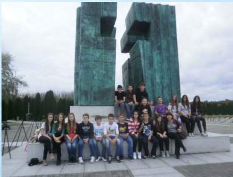
Osmaši u Vukovaru, listopad 2013.