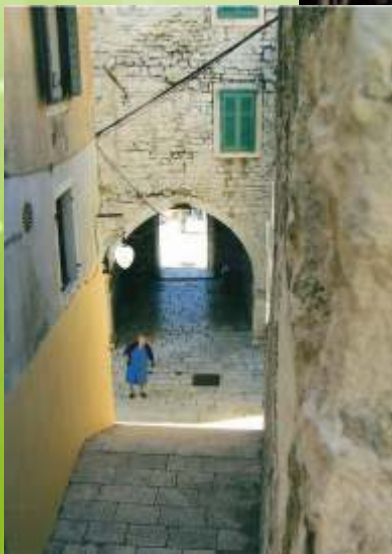
Anina fotografija s državnog

Budući da je natjecanje bilo jubilarno, imali su čast biti dio milenijske fotografije koju je iz ptičje perspektive snimio Šime Strikoman.