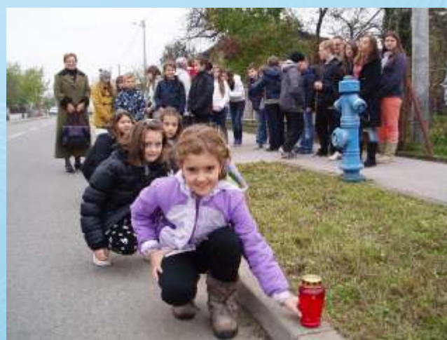
Predstavnici učenika svakog razreda palili su svijeće u Ulici grada Vukovara

Uključivali smo se u akcije Caritasa i Crvenoga križa