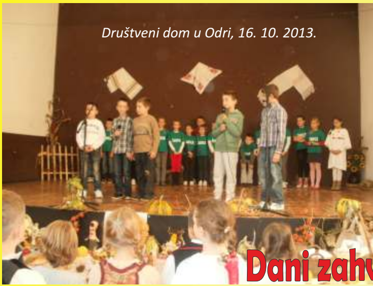
Društveni dom u Odri, 16. 10. 2013.