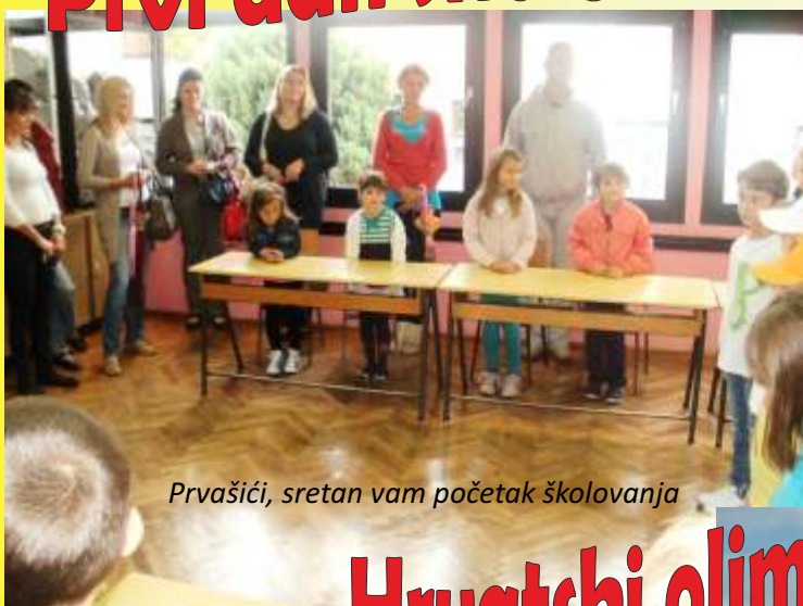
Prvašići, sretan vam početak školovanja