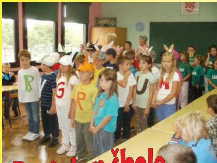
Prvi dan škole

Učiteljice i učenici naše područne škole marljivo rade tijekom cijele godine. Obilježavaju sve važnije datume, odlaze na terenske nastave, u kino, kazalište, sa smiješkom na licu dočekuju male prvašice, bave se sportom. U kolažu vam predstavljamo dio njihovih aktivnosti kroz godinu.