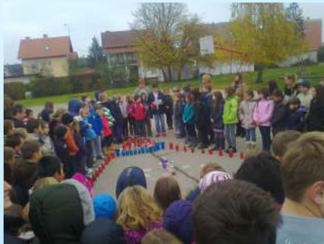
Paljenje svijeća na školskom igralištu i molitva za pokojne