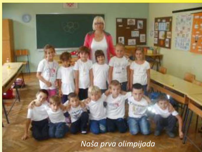
Naša prva olimpijada