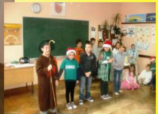
Uredio: Filip Kralj, 6.a