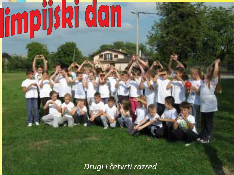
Drugi i četvrti razred