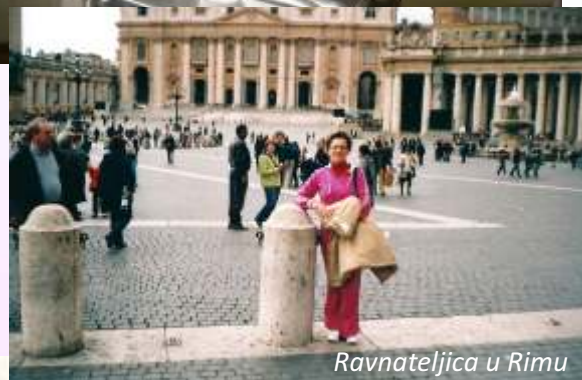
Ravnateljica u Rimu