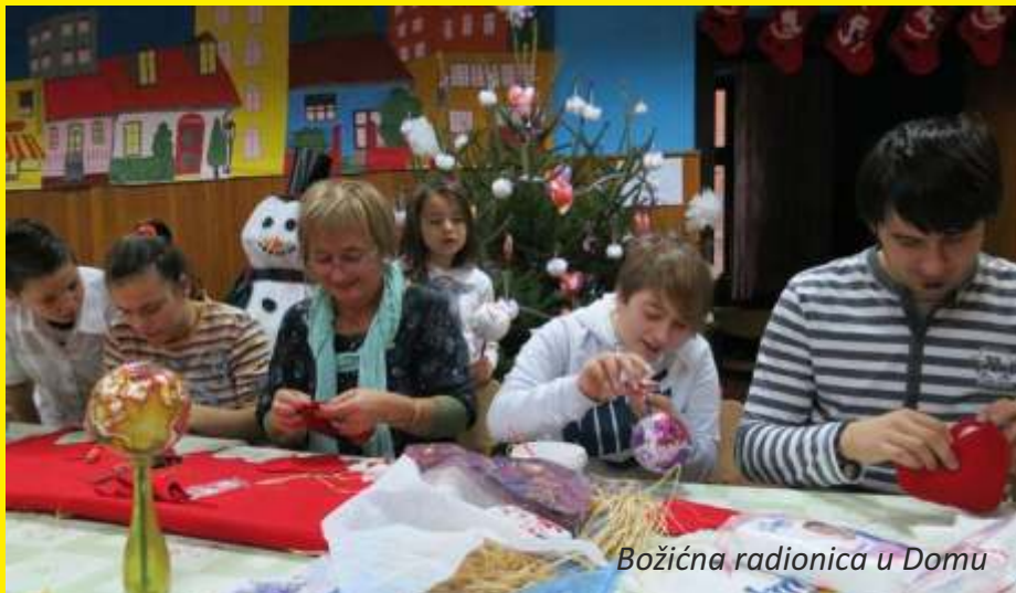
Božićna radionica u Domu