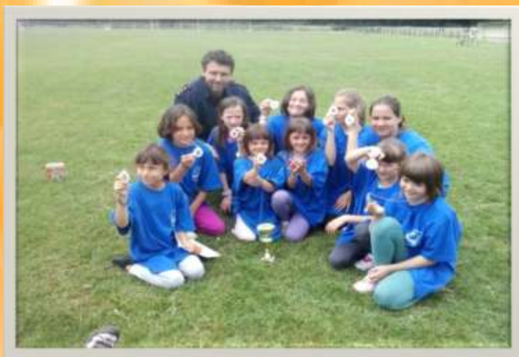
Na županijskom natjecanju za djecu i mladež 2013. osvojili su 2. mjesto