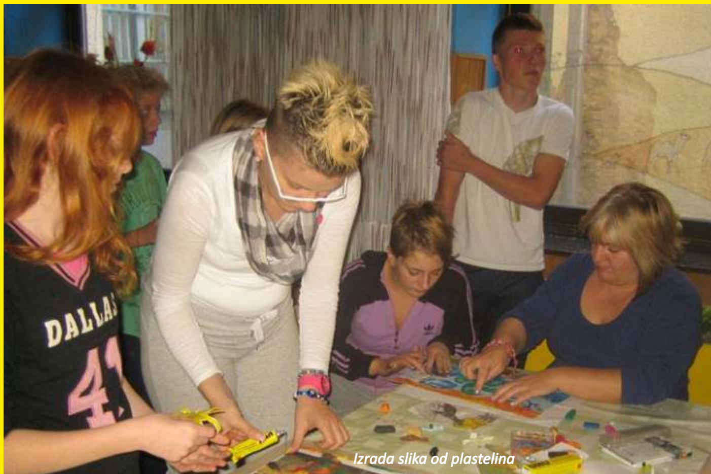
Izrada slika od plastelina